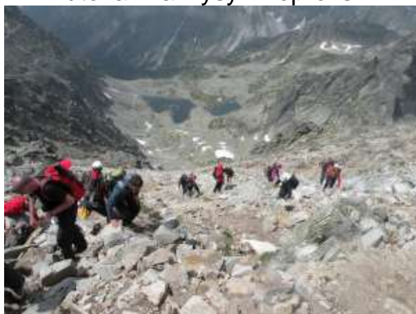
Detalj sa uspona