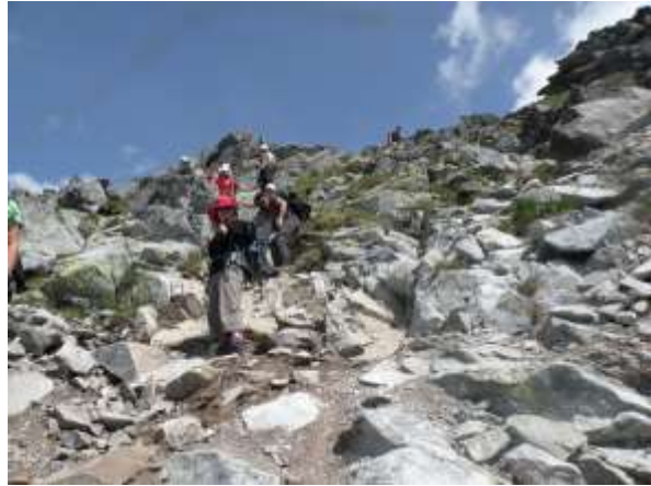
Završni deo uspona