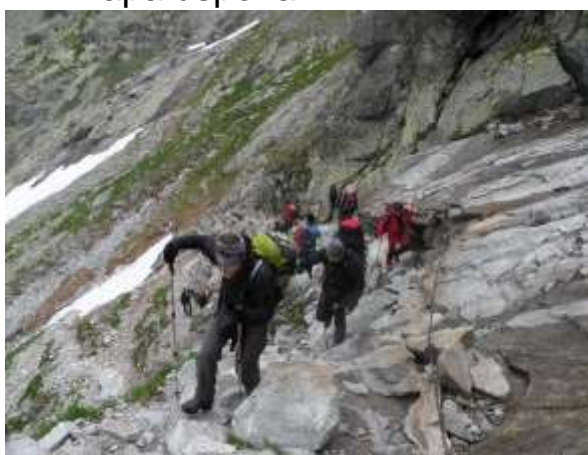
Sajle na usponu