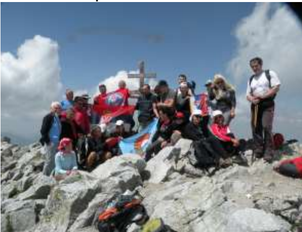
Grupa na Krivanu