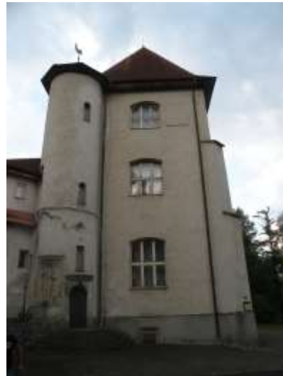
Dvorac u Kralevoj Lehoti

Druga grupa, za vreme uspona na vrhove Visokih Tatri, obilazi Liptovski Mikulas , vodopade Studene doline i Stari Smokovec.