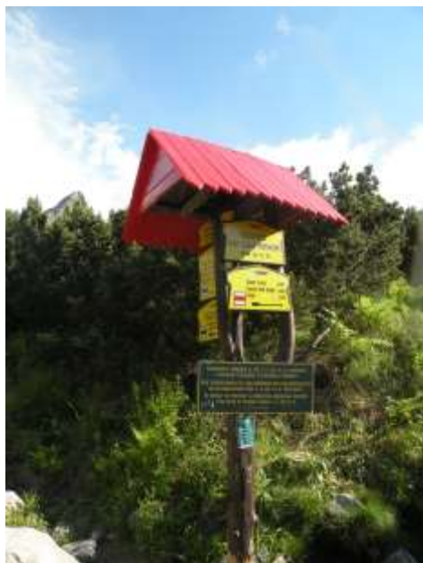
Putokaz za Rysy i Koprovski štít

Dužina planinarske ture je 12km sa vesinskom razlikom od 200m. Staza se preporučuje početnicima i traje oko3h.